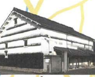
藤村製絲 藤村製絲記念館