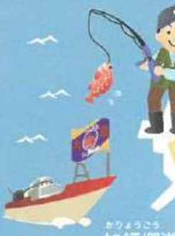
かりょうこう 加領郷港