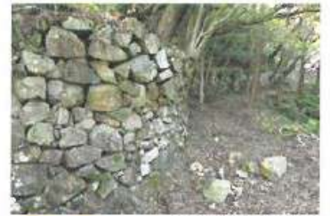
加領郷のシシ囲い