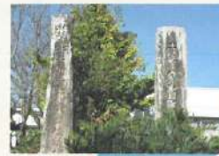
土佐日記那波泊の碑と能勢達太郎誕生地