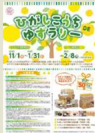
ひがしこうちDEゆずラリー