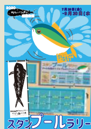
あなたのシラない魚介 ~スタンプラリー~