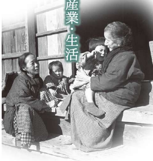
②泣く子をあやすおばあさん