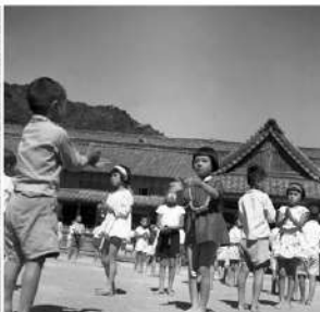
⑦安田小学校運動会