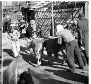
⑩売られていくあかうし