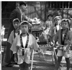
⑧神峯神社秋季大祭の子ども神輿