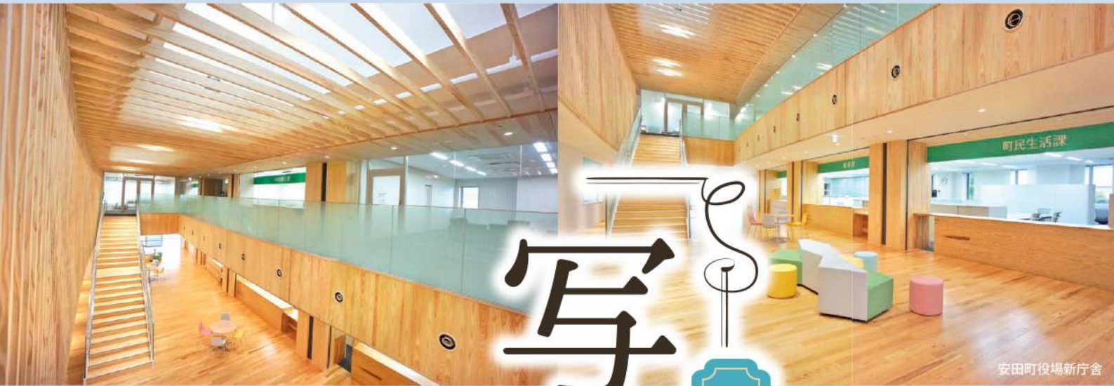
安田町役場新庁舎