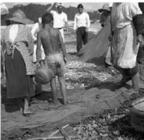
⑥唐浜に曳き上げられた地曳網