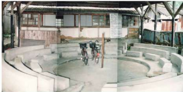
牛のせり市場 (撮影者: 西岡照郷氏、平成12年10月8日撮影)

安田川流域に拓かれた安田町は、中山間地での林業、平野部での農業や園芸が盛んで、これらの産物の集散地として繁栄してきました。 安田町役場旧庁舎が完成したのは昭和46(1971)年。日本社会は戦後から復興を遂げ、高度経済成長期の末にさしかかった頃です。それから49年を経て、今年令和2(2020)年7月に安田町役場新庁舎が完成しました。 今回の役場新庁舎完成を記念して、戦後以降を中心に、安田町民が撮影した安田の自然・まちなみ・交通・農業・産業・文化・風俗などの写真展を開催します。