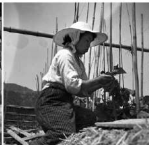
⑨きゅうり栽培の様子