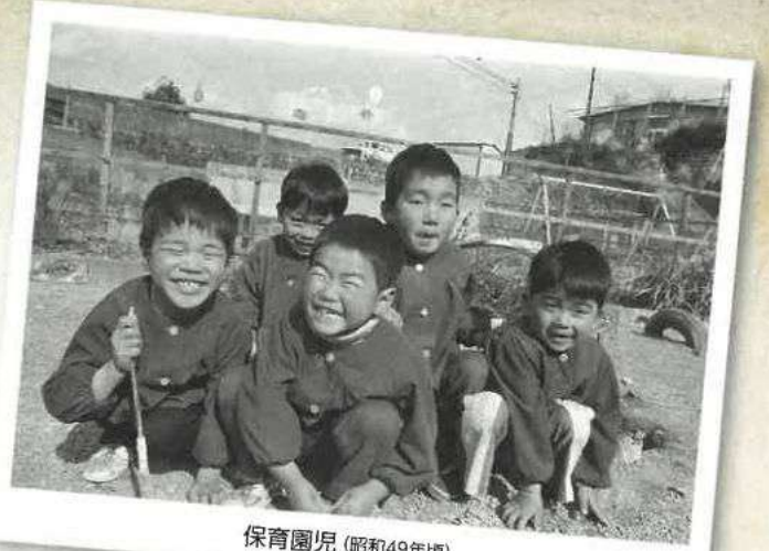
保育園児 (昭和49年頃)

写真に写る懐かしい友達、お世話になった方々、そしてあの日々の自分に会って懐かしい思い出にひたってください。