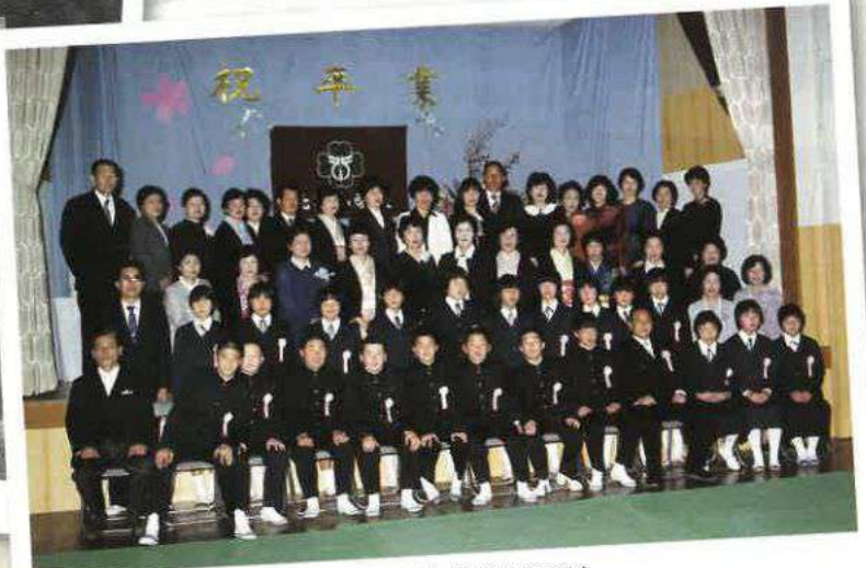
北川小学校卒業式 (昭和58年)