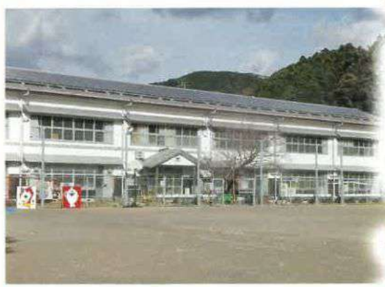
北川小学校 (令和2年)