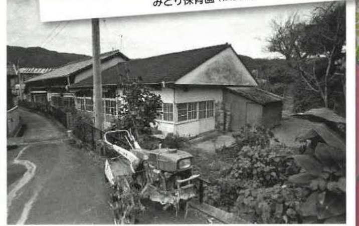
みどり保育園 (昭和49年)