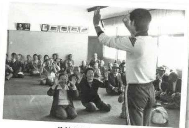
高齢者教室 (昭和40年代)