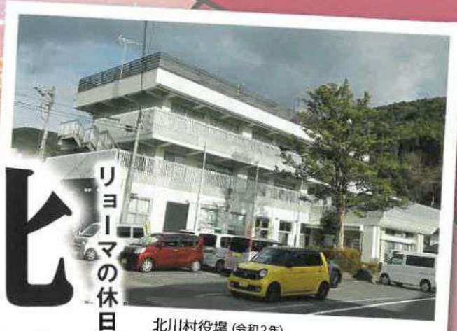
北川村役場 (令和2年)