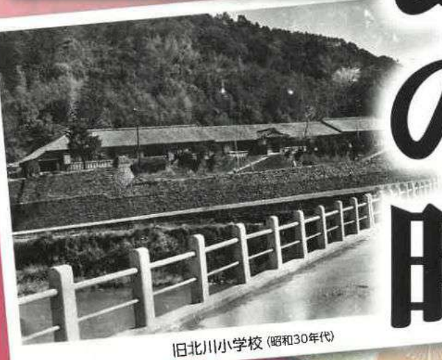
旧北川小学校 (昭和30年代)