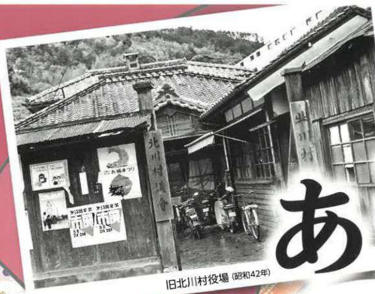
旧北川村役場 (昭和42年)