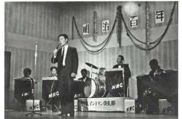
マンドリン倶楽部発表会 (昭和43年)