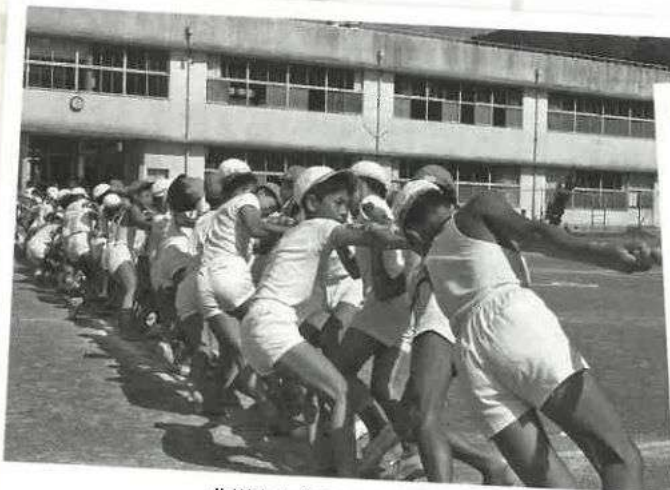
北川小中合同運動会 (昭和43年)