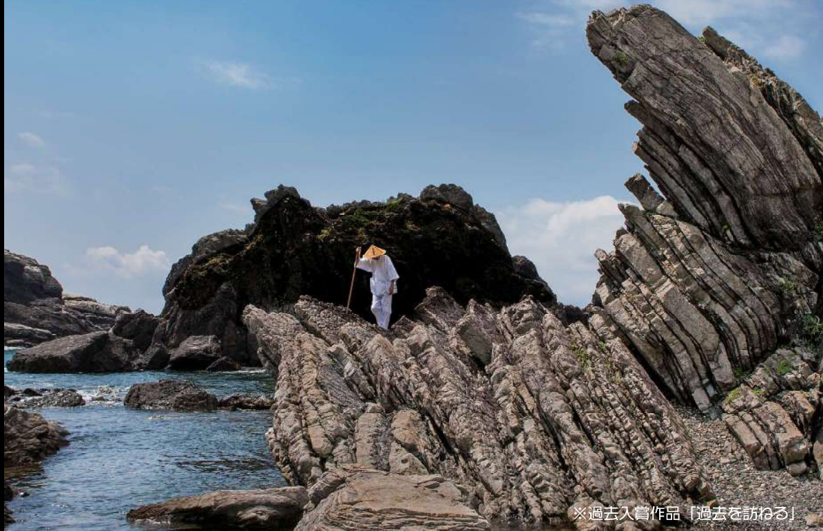
※過去入賞作品「過去を訪ねる」