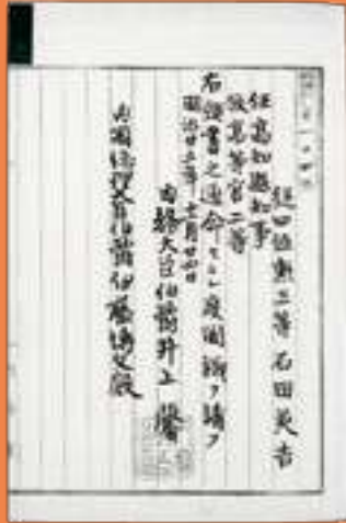
高知県知事就任（国立公文書館） 明治25年11月24日、第12代高知県知事に任ぜられた。