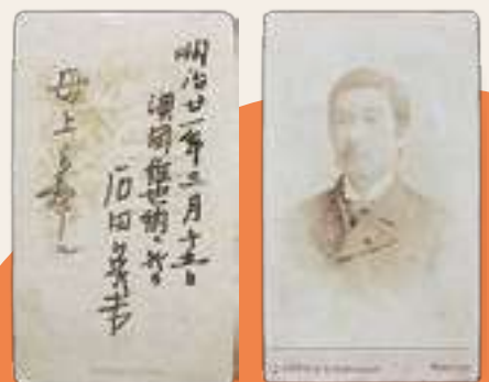
石田英吉肖像写真 明治21年3月15日ウィーンで撮影された写真。母・岩に送ったことが裏面に記されている。