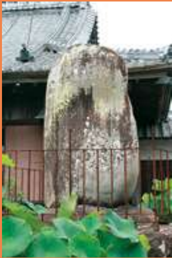
二十三士顕彰碑（田野町福田寺） 高知県知事就任以降、維新の志士の顕彰活動に取り組む。石田は二十三士の首領清岡道之助、副首領清岡治之助を慕っていた。また二十三士のメンバーの多くが高松順蔵の私塾や田野学館で共に学んだ同志たちであった。

本企画展では、石田英吉の生涯を勤王の志士としての活躍から高知県知事時代の功績と多くの志士たちとの交友などに焦点をあて紹介。