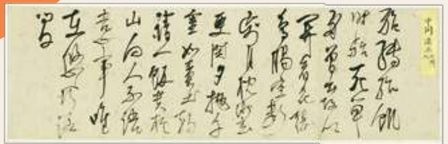
『亡友帖』中岡慎太郎漢詩（国立国会図書館） 書状などを貼りまぜて仕立てた巻子。特に思い入れの深いものをまとめたのだろうか。『亡友帖』からは石田の交友関係が分かる。