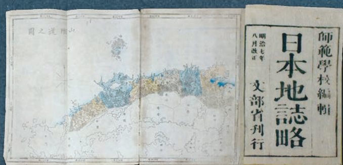
「日本地誌略 明治7年(1874)刊」

安田町には江戸時代末、十三の寺子屋や塾があったことが分かっており、明治時代以前より「学び」に対して意欲的な町でした。近代の学制発布後は、小村ごとに多くの小学校が誕生しましたが、現在は安田小中学校のみとなっています。安田町の学校の変遷を中心に、各年代の学業内容・学校行事や使用していた教材、また、かつて学校で実際に使われていた給食食器や机・イスなどと共に、当時の写真を展示して懐かしい学校の姿も紹介します。