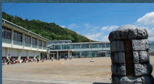
「現在の安田小学校」