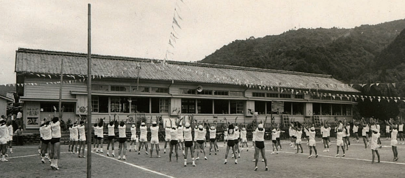
「旧中山小学校校舎(昭和30年代)」