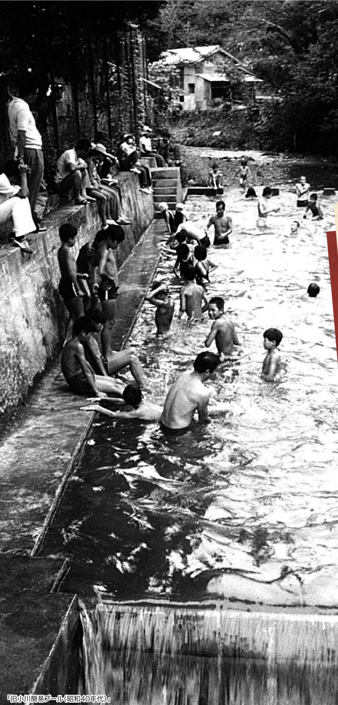
「旧小川簡易プール(昭和40年代)」