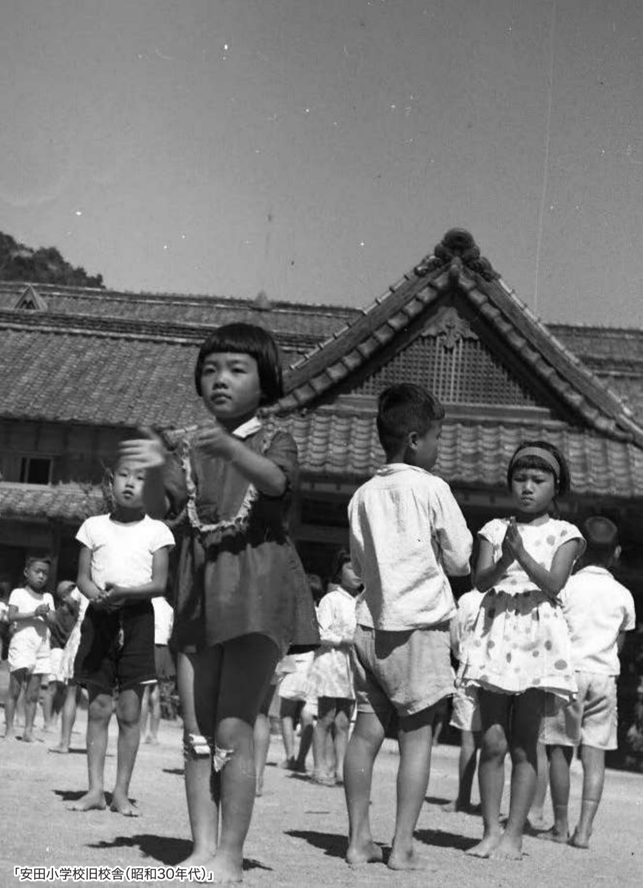
「安田小学校旧校舎(昭和30年代)」