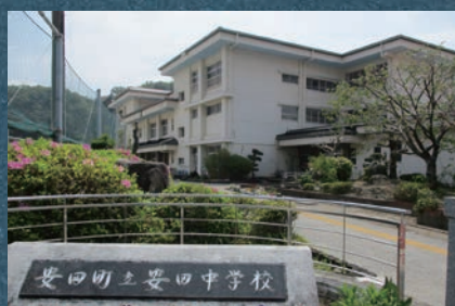
「現在の安田中学校」