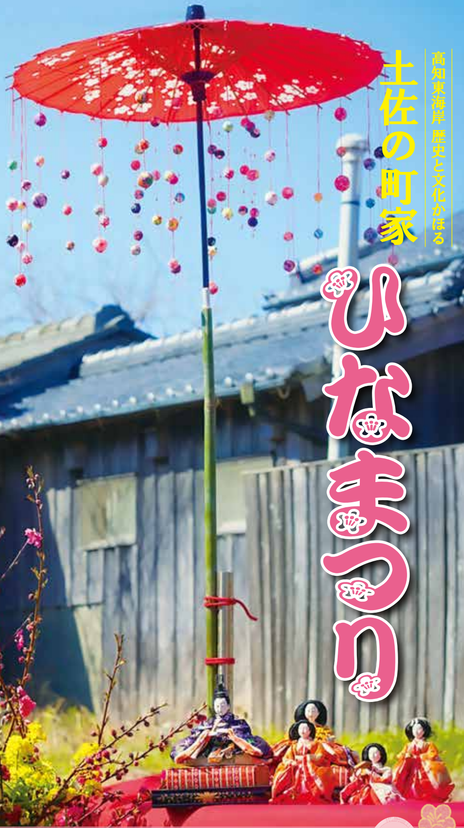
写真：吉良川町宮の内